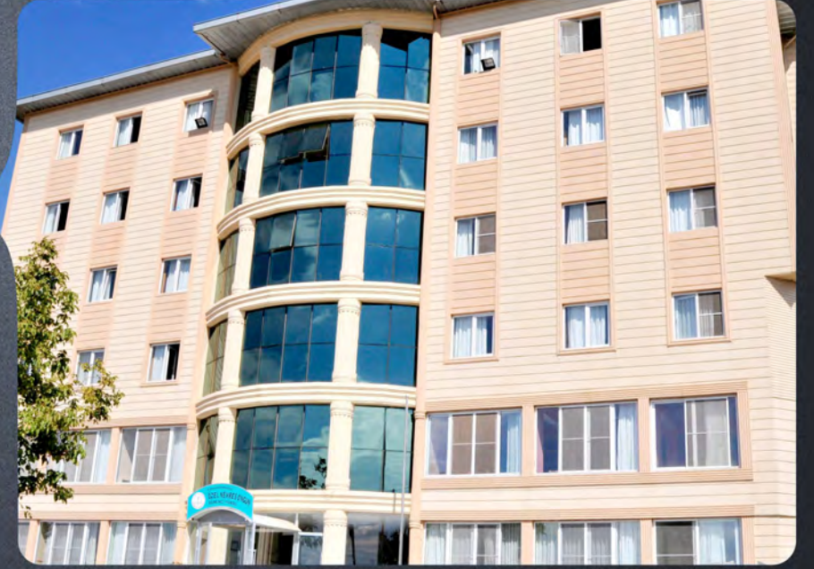
Nevres Ongun Öğrenci Yurdu Nevres Ongun Student Dormitory

We are seeing our social responsibility as leaving livable environment to the next generations and maximum contributing to the education of young persons. In this light, we are managing all business processes in high environment awareness and we are trying to support education to the social projects.