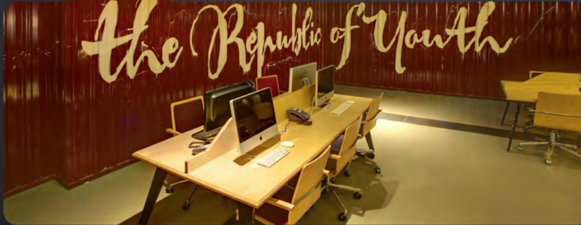
Nevres Ongun Gençlik Merkezi Nevres Ongun Youth Centre